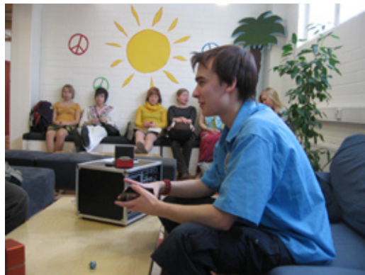
Hippipäivän kesäistä tunnelmaa talvella 2008.

Joululoman jälkeen uusi oppilaskunnan hallitus tarttui toimeen innolla ja piti järjestäytymiskokouksensa tammikuun 16. päivä. Kokouksessa päätettiin puheenjohtajan, sihteerin ja muiden titteleiden nimeämisestä. Seuraavat viikot kuluivatkin hallituksen