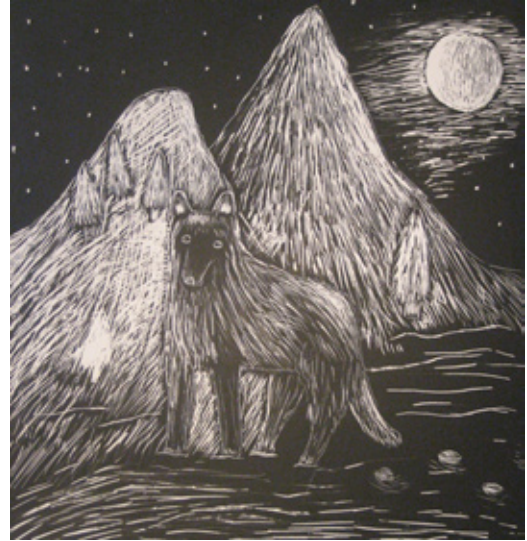
Talviyö (Reetta Kesti)