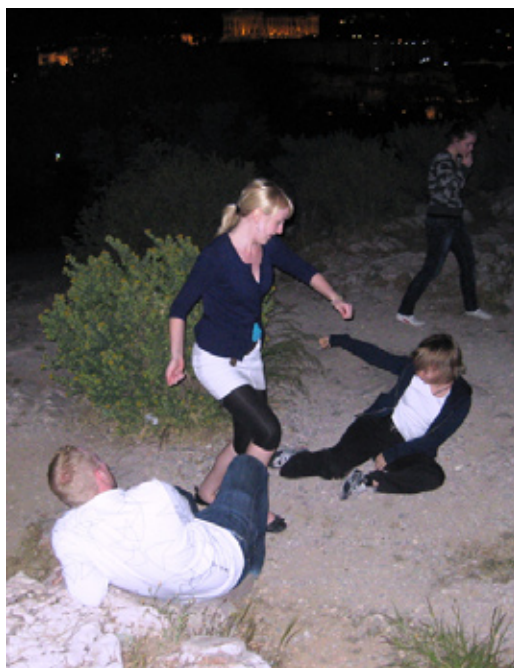
Antiikin näytelmien esityksissä oli vauhtia ja dramatiikkaa.