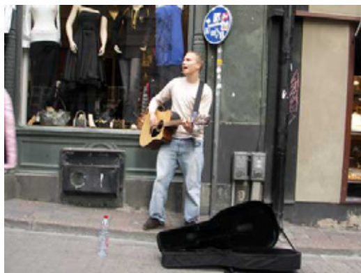
Tukholmassa matkakassaan hankittiin katusoitolla.

Tukholmalaisessa lukiossa oppilaskuntatoimintaa tukevat esim. vanhempainyhdistys, ulkopuoliset sponsorit, kaupunki ja opetushallitus. Heidän toimintansa suuntautui hyvin paljolti viihtyvyyden lisäämiseen erilaisten tapahtumien järjestelyjen muodossa. Meidän oppilaskunnan hallituksemme toiminta herätti Norra Realin oppilaskunnan hallituksessa kunnioitusta suunnitelmallisuudellaan ja sillä, että hallitus pystyy oikeasti vaikuttamaan koulun toimintaan.