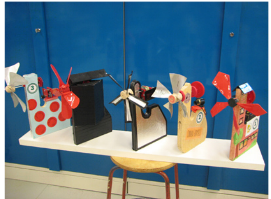
Valmiita tuuligeneraattoreita odottamassa sopivia tuulia!

Lisää tietoa leireistä löytyy osoitteesta http://www.tek.fi/index.php?432 .