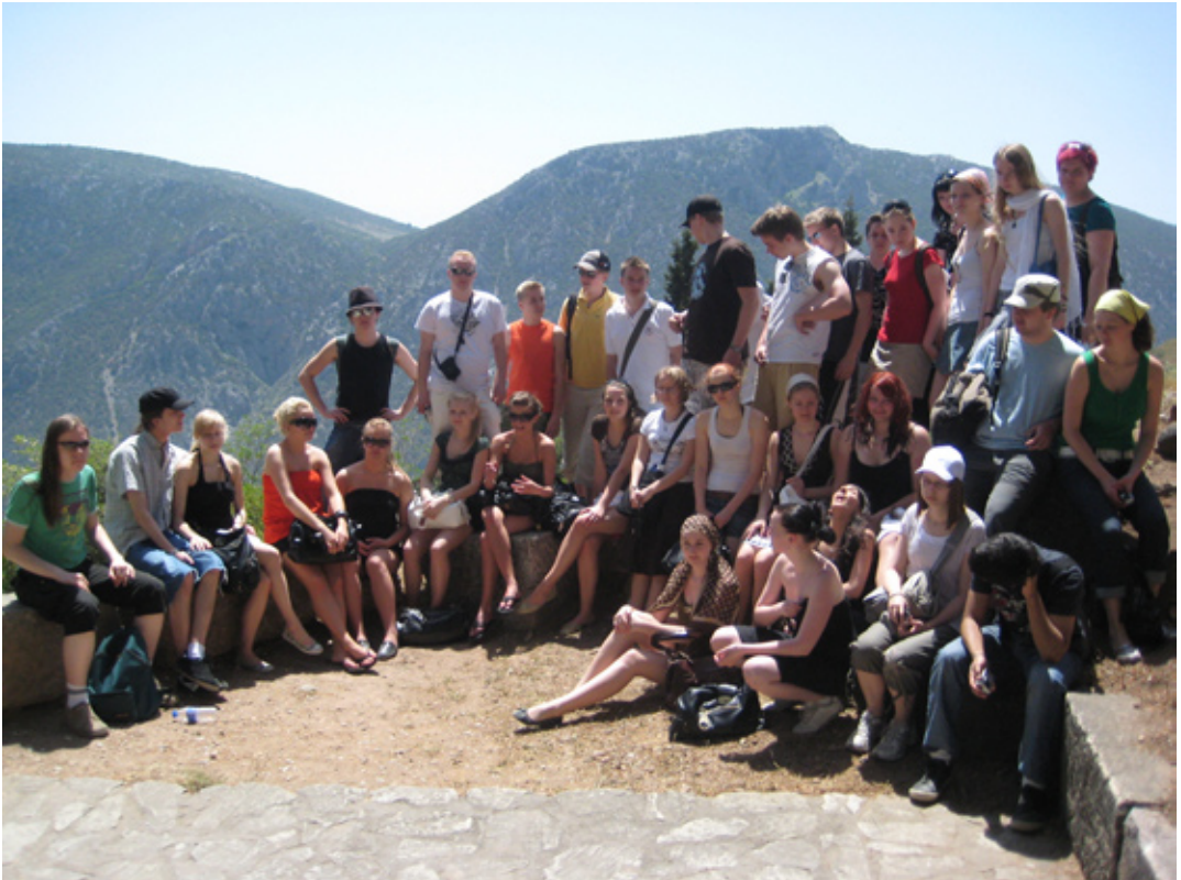
Oulun ja Turun antiikkikurssilaiset Delfoin jyhkeissä maisemissa.

Siirryimme Ateenaan halvinta mahdollista reittiä, mikä tarkoitti lähes vuorokauden raskasta matkustamista sekä meno- että tulomatalla. Saa-vuimme torstaina eli vappuna aamuyöllä tuttuun Exarchion -hotelliin. Muutaman tunnin yöunen jälkeen astelimme jo tutustumassa kaupunkiin ja sen keskeisiin nähtävyyksiin. Vasemmiston mielenosoitukset ja kova meteli sävyttivät ateenalaista vappua. Iltapäivällä aloitimme antiikkiosuuden vanhalta olympiastadionilta. Illan hämärtyessä kohtasimme turkulaiset Muusain kukkulalla. Jaoimme oppilaat yhdeksään sekaryhmään ja panimme ne valmistelemaan antiikkiin liittyviä näytelmiä. Euroopan