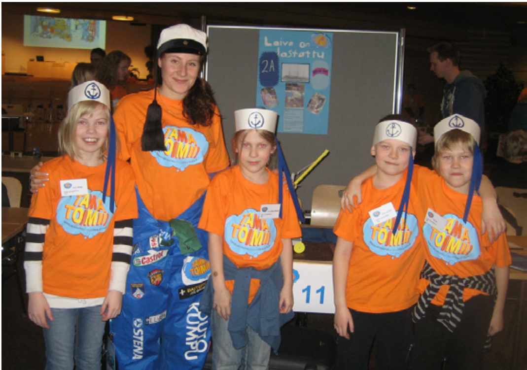
Tutorin onnentoivotukset Otaniemen loppukilpailussa.