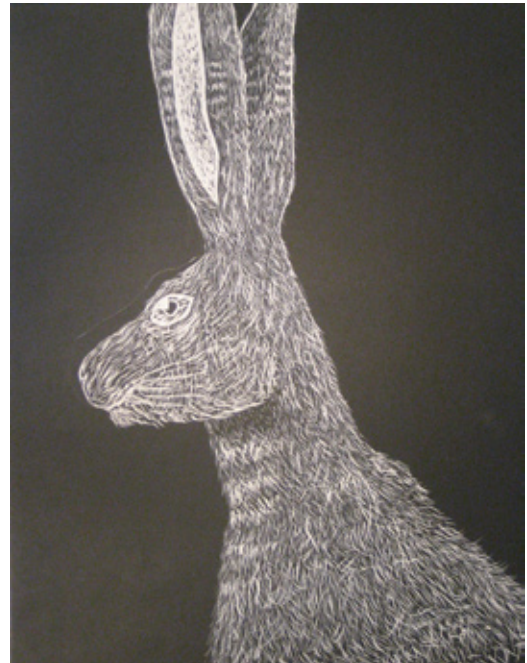
Jänis (Reetta Siikavirta)