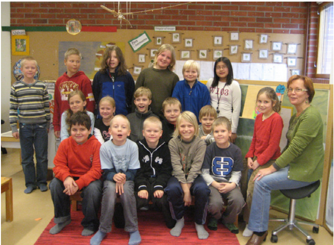
Oulun normaalikoulun perusasteen 0–6-luokkien oppilaskunnan hallitus lukuvuonna 2008–2009.

Oppilaskunnan hallituksen työskentelyssä harjoitellaan kokouskäytänteitä. Virallisiin kokouksiin laaditaan esityslista. Käsitellyistä asioista tehdään