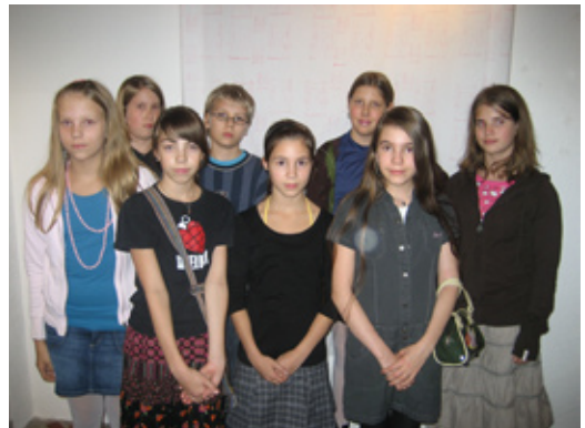
6a- ja 6b-luokan oppilaita tekstiilityön opettajansa kanssa näyttelyn avajaisissa.