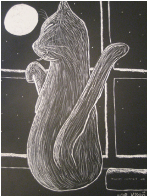
Kuun valossa (Taru Järvelä)