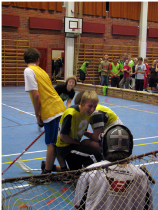
Sählysessiossa meno ei ollut liian totista, mutta ei pelistä puuttunut vauhtiakaan.

Lopulta voittajaksi selvisi abiturienttien joukkue Lihapiirakka yhdeksänhenkisellä miehityksellään. Kenties ensi vuonna on revanssin mahdollisuus.