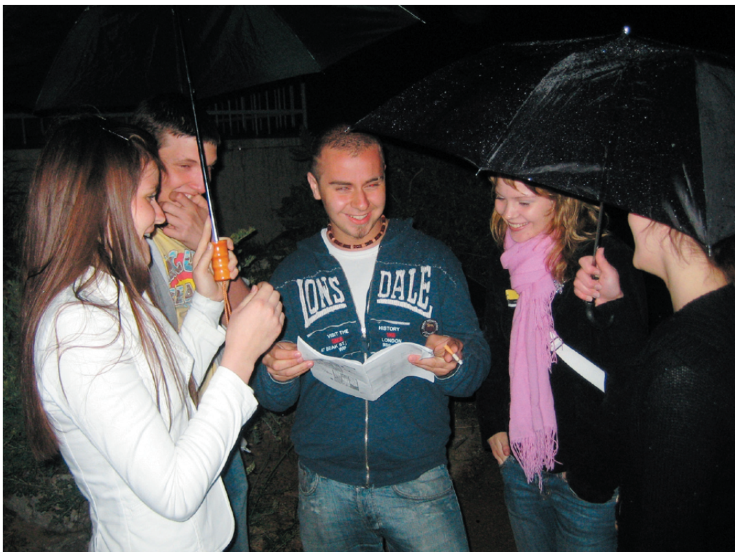
Sateesta huolimatta hymyt olivat herkässä Oulun ja Turun norssilaisten valmistellessa sekaryhmissä esityksiään Muusain kukkulalla.

Lauantaiaamuna tutustuimme maailman parhaaseen antiikkimuseoon eli Ateenan arkeologiseen kansallismuseoon. Iltapäivällä suuntasimme Kerameikokseen, joka oli vihdoinkin avattu kävijöille vuosien kaivausten ja remontoinnin jälkeen. Sunnuntai oli Agora-päivä monine kohteineen. Myös Attaloksen stoa museo oli pitkästä aikaa auki. Vappuaattoa vietettiin hillitysti, sillä maanantaina oli ohjelmassa vielä kiipeäminen Likavitos-kukulalle, Dionysoksen teatteri ja yhteinen päättäjäsillallinen