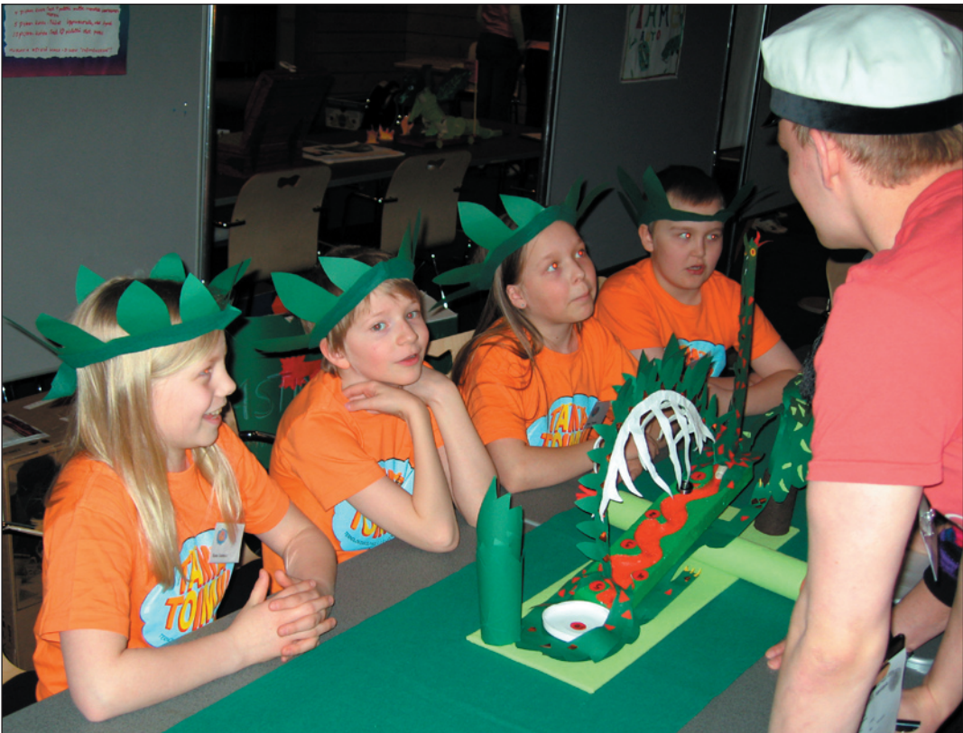
Voittoisa työ tuomariston arvioitavana