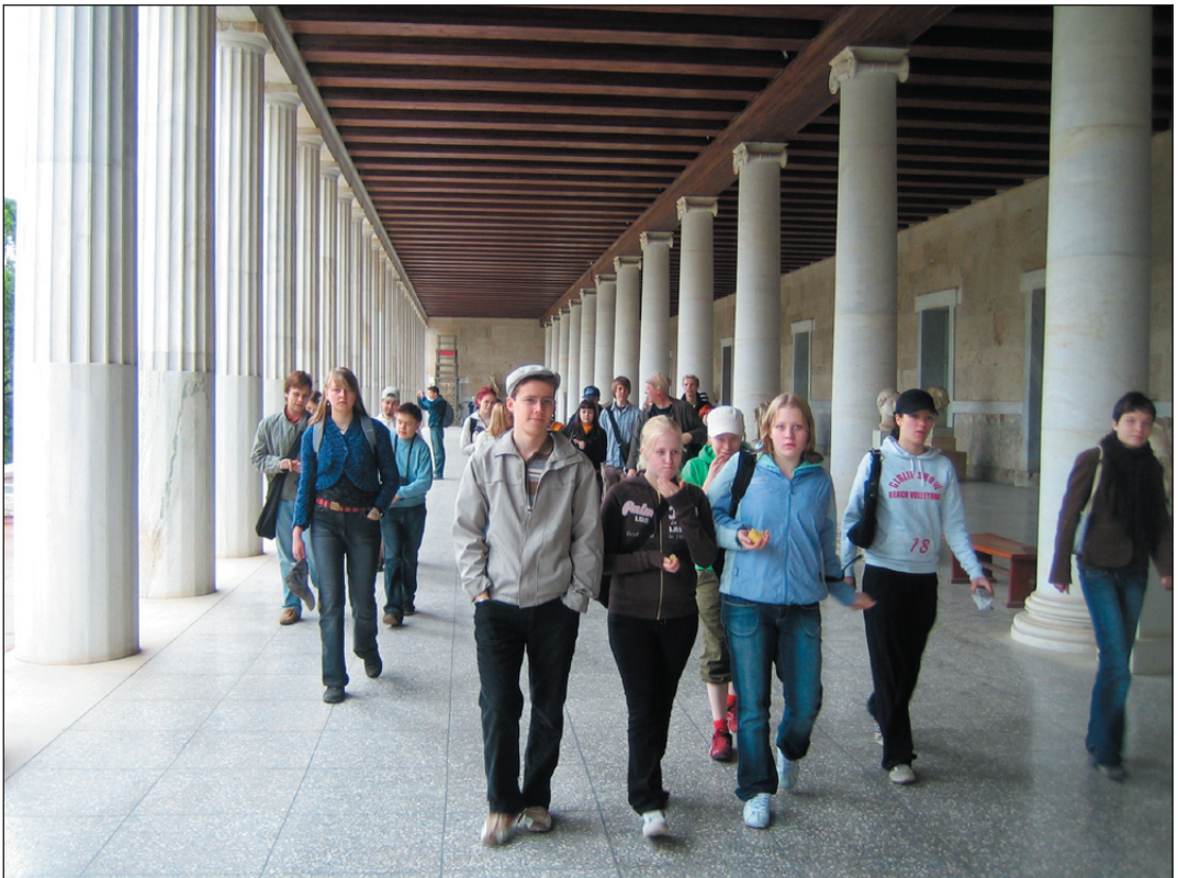
Antiikkikurssilaiset tutustumassa Attaloksen stoaan.

Lähes vuorokauden kestäneen, halvimmalla mahdollisen, juna–bussi–lento–Praha–lento–bussi–seikkailun jälkeen saavuimme aamuyöllä Exarchion-hotelliimme Ateenaan. Puolelta päivin olimme jo astelemassa kartat kädessä suurkaupungin vilinässä. Tarkoitus oli hahmottaa kaupunki kolmen keskeisen aukion avulla ja samalla tutustua matkan varrella oleviin kohteisiin. Kävelyä tulikin askelmitarin mukaan heti kättelyssä kahdeksan kilometriä. Omonia-aukiolta lähdettyämme ihmettelimme hetken valtavan kauppahallin hulinaa ja erikoisia tuoksuja. Sieltä astelimme Monastiraki-aukiolle.