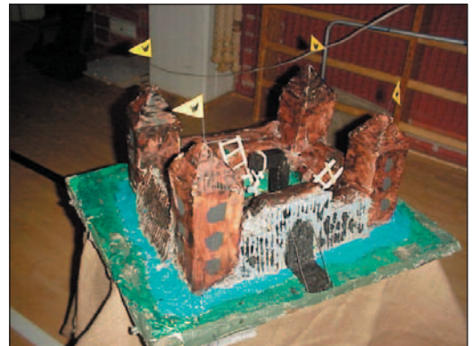
Oulun linnan pienoismalli