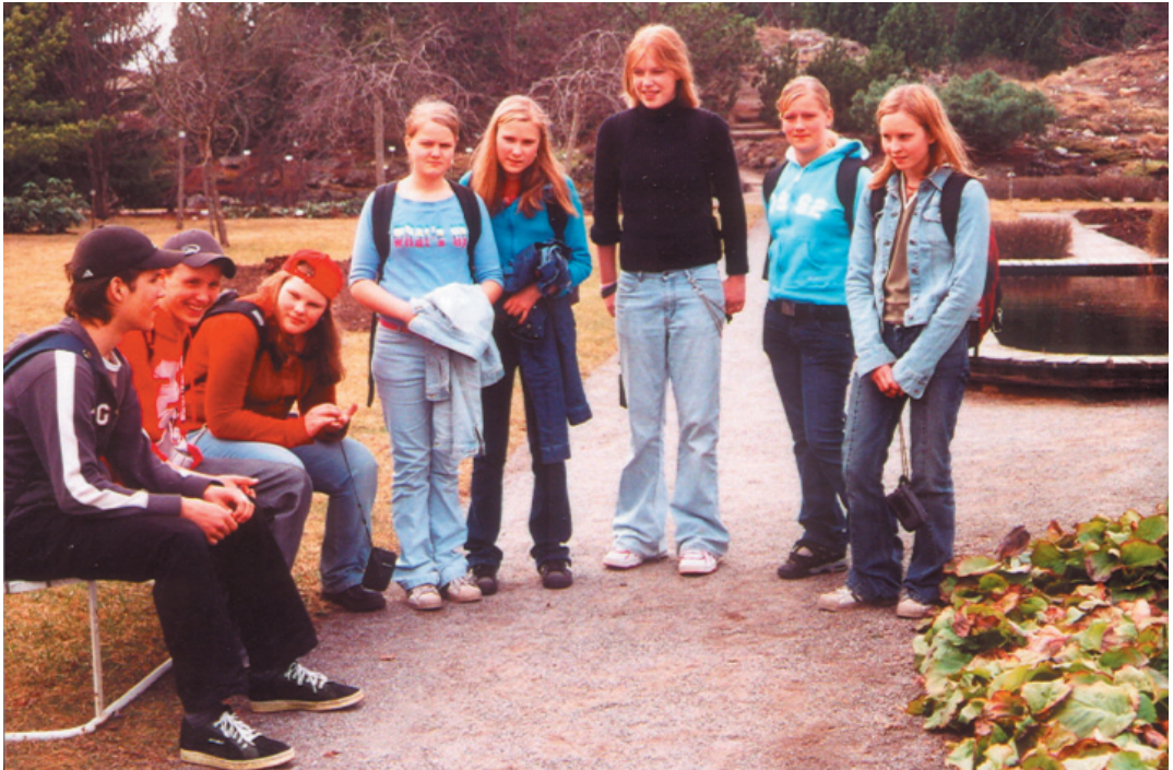
Ystävyys voimistui viikon aikana. Annijoen nuoret norssin isäntäoppilaiden seurassa.

Ohjelma, jonka Merja Marjakangas oli laatinut osaksi meidän toivomustemme mukaan ja osaksi 8d:n lukujärjestyksen mukaan, toimi erittäin hyvin. Oppilaiden toivomuslistalla olivat muiden muassa Tietomaa, Eden ja kasvitieteellinen puutarha. Aamupäivät olivat