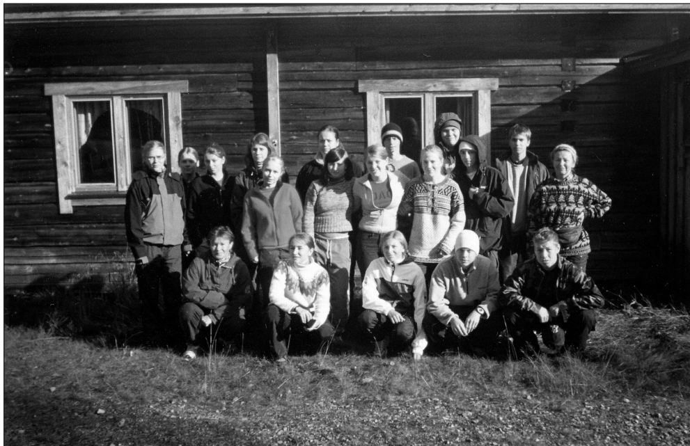
Tunturivaellusporukka Orresokan kämpällä.