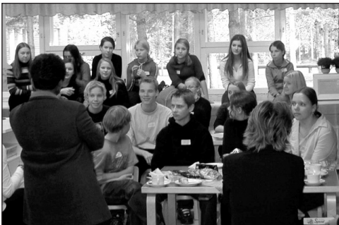
Osallistujakoulujen opettajien tapaamisen yhteydessä Norssin oppilaat maistelivat vieraiden kanssa kotitaloustunnilla loihittuaan suomalaisen ruokakulttuurin erityisherkkua.

NIE -hankkeen tavoitteena on ollut kokeilla ja kehittää telekommunikaation avulla tapahtuvaa viestintää ja sen eri muotoja. Käytännössä se on tarkoittanut kuukausittain tapahtuvia monipistevideoneuvotteluja. Kulloinkin vähintään viisi osallistujatahoa on ollut samanaikaisesti sekä puheetta näkökatsekontaktissa toisiinsa samoilla puhelinlinjoilla. Istuntojen kokouskielenä käytettiin englantia. Hankkeen kestäessä sen perusmuotoja ja toimintamallia on kehitetty yhä vuorovaikutteisempaan ja luonnollisempaan keskustelun suuntaan. Kun hanke aloitettiin, silloiset 7-luokkalaiset kustakin maasta pitivät vuorotellen esityksiään yhdessä sovitusta ja ennalta valmistelluista aiheista. Nyt hankkeessa on edetty vaiheeseen, jossa esitykset toimitetaan oppilaille jo etukäteen ja niiden perusteella käydään keskustelua "seminaarin" tapaan. Istuntojen aiheet ovat vaihdelleen EU:n ja maailman ajankohtaisista aiheista, kuten eurosta aina lähi- ja etäkulttuurien tarkasteluun. Toukokuun istunnossa esiteltiin kunkin osallistujakoulun omaa toimintaa ja sitä kautta vertailtiin eri maiden koulujärjestelmiä.