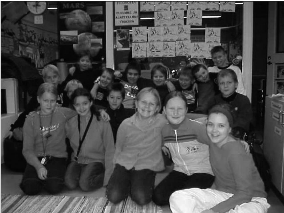
Kuva. 4a-luokan pikkufilosofit osaavat keskustella, pohtia ja kyseenalaistaa asioita.