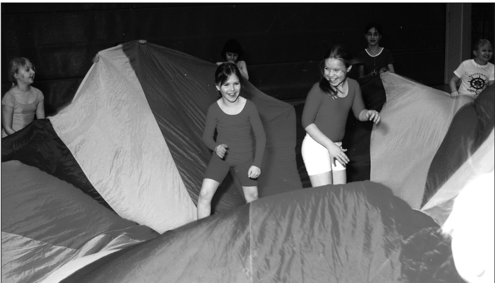
Kolmasluokkalaisten liikunnanriemua.