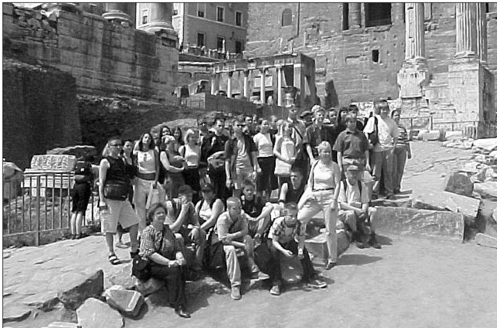
Matkalla Pantheonin.

miskokemuksia riitti niin valtavasti, että niissä riittää sulatteleminen loppuelämäksi. Lukemattomien historiallisten muistomerkkien ja muiden kohteiden myötä antiikin aika alkoi elää aivan uudella tavalla. Astelu keisareiden jalanjäljissä Forum Romanumilla ja Capitoliumilla sekä apostoli Pietarin jalanjäljissä Via Appialla opetti antiikin historiaa luontevammin kuin parhaatkkaan oppikirjat tai tietokoneohjelmat. Colosseumin jyhkeät muurit kertoivat omaa synkkää tarinaansa. Käynnit Pantheonissa, useissa keskiaikaisissa Maria-kirkoissa sekä Pietarinkirkossa avasivat näkemyksiä antiikin Rooman uskonnosta ja kristinuskon synnystä. Pelkkä maanpinnalla pysyminen ei kurssilaisille riittänyt: väliin küpesimme Pietarinkirkon 137 metrisen kupolin huipulle, ja seuraavana aamuna olimme jo Callistuksen katakombialueella liki parinkymmenen metrin syvyydessä tutkimassa varhaiskristittyjen hautoja. Nykyisen paavin näkeminen elävänä oli monelle matkan kohokohtia.